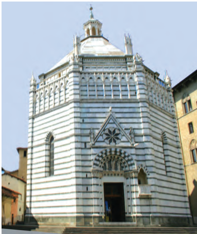
▲ Baptisteriul. Secolul al XIV-lea. Piazza del Duomo. Pistoia

Planul de formă circulară are un diametru de 35 m. Silueta masiv cilindrică are patru intrări cu portaluri împodobite auster. Edificiul reia parțial soluția Panteonului din Roma, întărit de centuri circulare. Impresionanta deschidere este acoperită cu o cupolă supraînălțată de o lanternă încununată cu statuia Sfântului Ioan Botezătorul, patronul edificiilor sacre destinate botezului. Baptisteriul posedă la interior o cristelniță de formă octogonală, impresionantă ca dimensiuni și formă, executată în 1260 de Guido Bigarelli. Amplasată în centrul spațiului baptisteriului, cristelnița, unicul obiect de cult, concentrează atenția în spațiul enorm al deschiderii, punctând importanța acordată actului liturgic fundamental al religiei creștine.