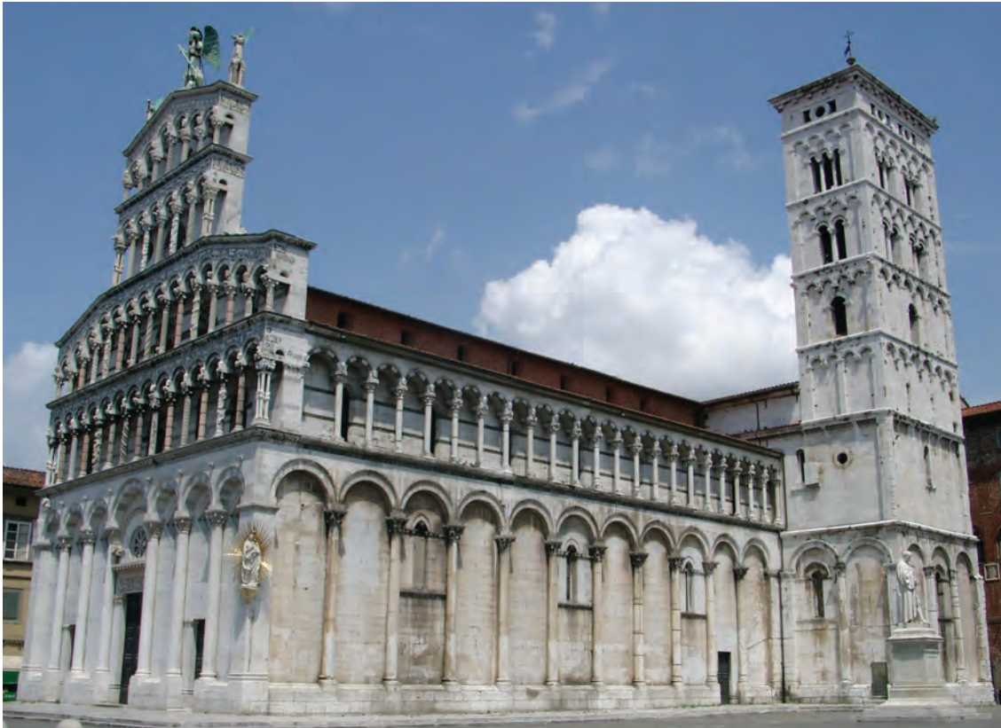
◀ Chiesa di San Michele și Campanila. Lucca

gotică a bolții cu multiple nervuri ogivale și arce butante au fost rareori folosite și doar parțial. În schimbul acestora au fost preferate plafonul cu casete decorative, șarpanta aparentă și bolta semicilindrică din lemn, placată cu decorație din piatră ori, în cazul domurilor, cupola bizantină pe pandantivi sau trompe de colț. Edificii, chiar foarte înalte, cum este Domul din Milano, au primit soluții constructive neconforme stilului gotic. În construcția stâlpilor de susținere, milanezii au preferat soluția ieftină a umpluturii de zidărie, în locul discurilor de piatră suprapuse, necesare stâlpilor fasciculați și coloanelor, soluție constructivă proprie goticului european. Procedeele italiene s-au demonstrat nesigur și a necesitat în timp numeroase intervenții.