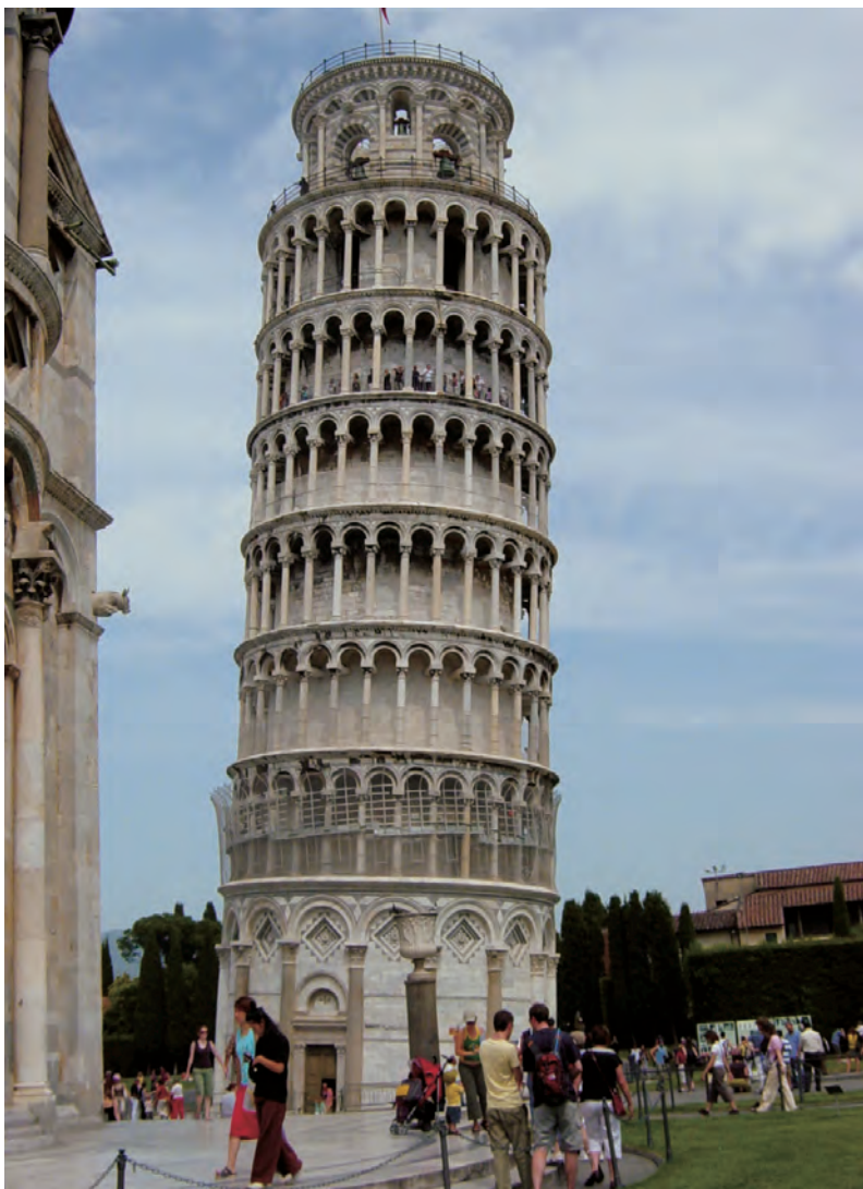
▲ Campo dei Miracoli. Campanila. Pisa