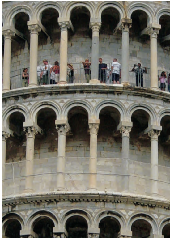
◀ Campanila. Detaliu. Pisa

Început în 1153, Baptisteriul din Pisa a fost terminat la începutul anului 1400.