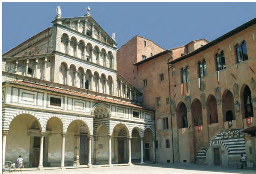
▼ Catedrala ( Domul ). Pistoia

Concepția formulată de arhitecții și artiștii toscani, caracterizată prin îndrăzneala concepției și originalitatea soluțiilor, s-a manifestat în